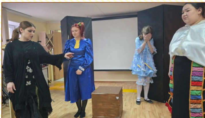
показ постановки «Марионетки», автор Антон Селивёрстов