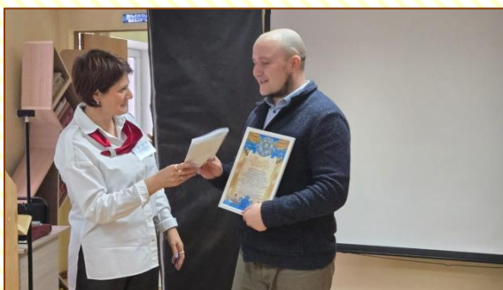
вручение благодарственного письма

Спасибо за ваши музыкальные, танцевальные номера, за прочтение поэзии.